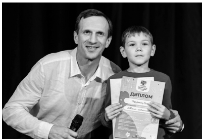
Рисунок 1. Награждение победителей конкурса «Авторы – дети»

Современная школа не может успешно реализовать свою деятельность без содружества с социумом на уровне социального партнёрства.