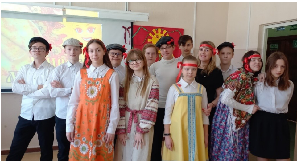
Рисунок 3. Праздник «Эх, Масленица, да ты красавица!» в 8 Д классе МБОУСОШ № 56 города Кирова, 2023 г.