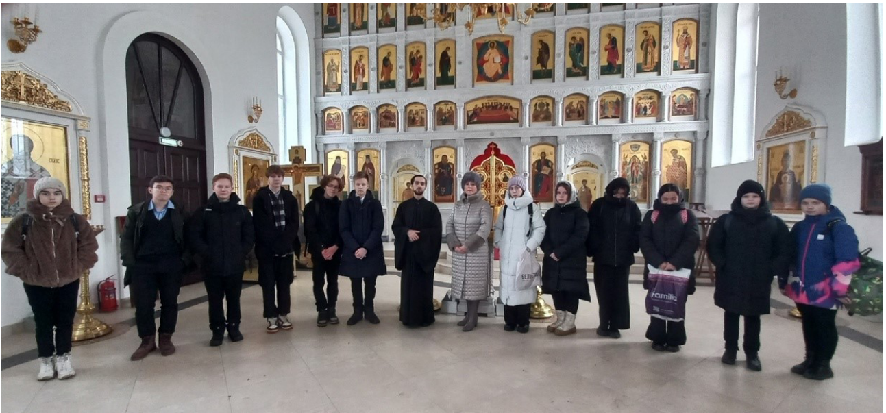
Рисунок 1. Посещение храма «Всех скорбящих радость» обучающимися 8Д класса МБОУСОШ №56 города Кирова, 2023 г.