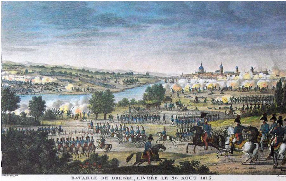
Карл Верне. Битва при Дрездене 14-15 августа 1813 г.