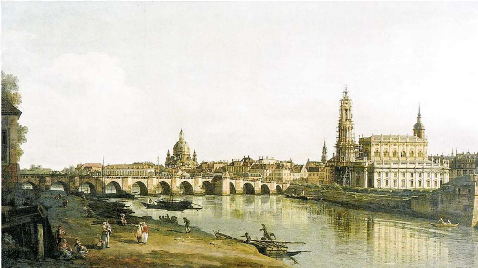
Вид на мост Августа и исторический центр Дрездена XVIII века.