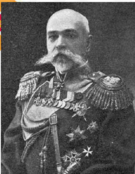
Губернатор Ф.Ф. Трёпов