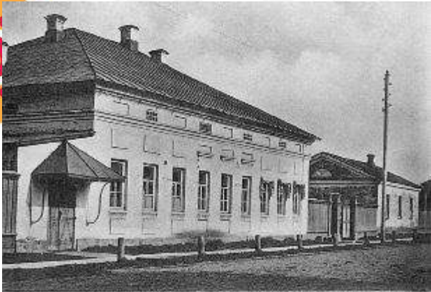
Первое посещение Вятской гимназии из дома Масленникова из 1811—1815 г.