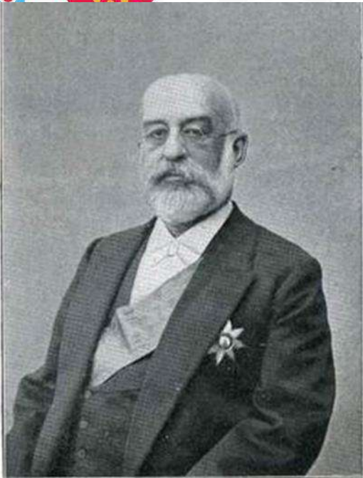
Губернатор Н.А. Тройницкий