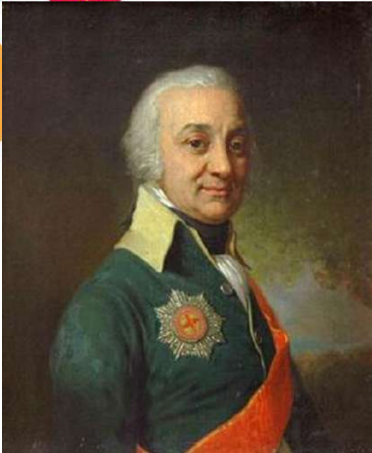
Губернатор П.С. Рунич