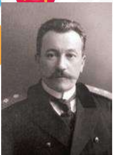
Губернатор П.Ф. Хомутов