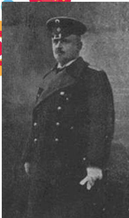
Губернатор А.Г. Чернявский