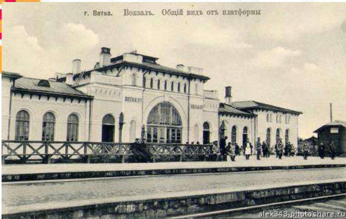
Железнодорожный вокзал Фотография начала XX в.