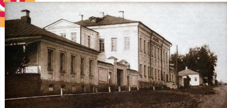
Вятская публичная библиотека. Фотография начала XX в.