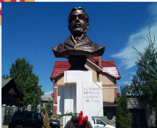
Памятник А.И. Вештомову