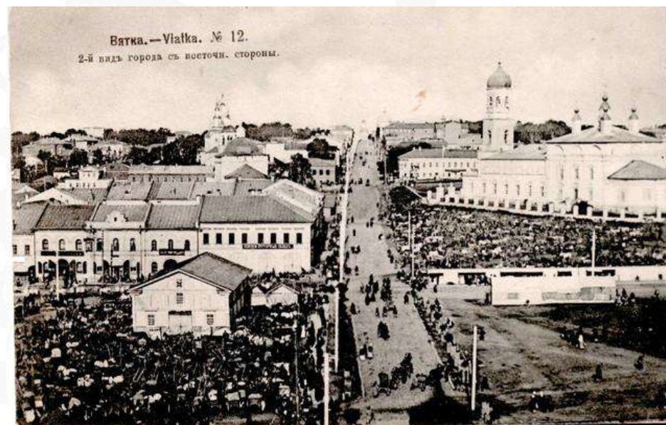
г. Вятка. Вид города с восточной стороны. Фотография начала XX в.