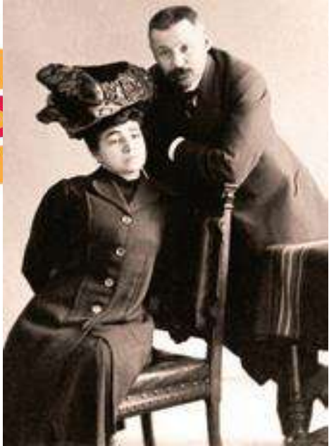
Губернатор П.К. Камышанский