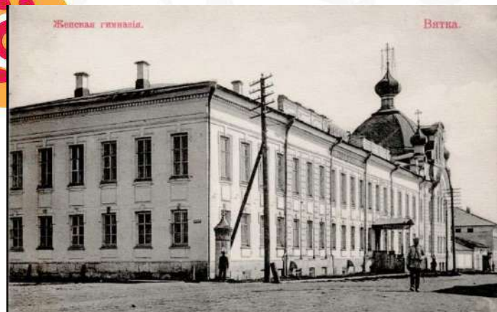
Вятская Мариинская женская гимназия. Фотография начала XX в.