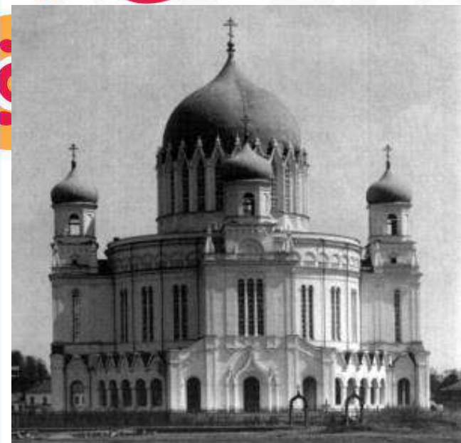
Алекса́ндро-Невский собор. Фотография начала XX в.