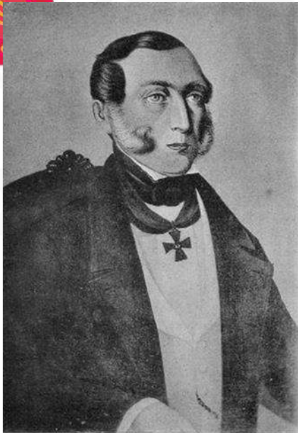
Вятский губернатор Ф. И. ФОНЪ-БРАДКЕ. 1808—1816 г.