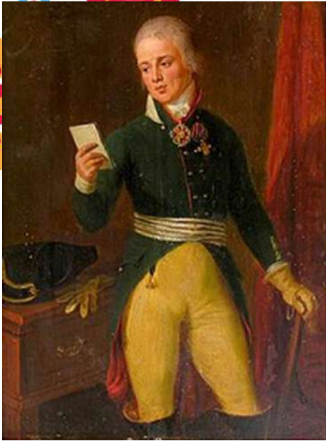
Губернатор Е.Е. Ры(е)нкевич. Художник Л. Гуттенбрунн