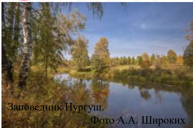
Заповедник Нургуш.