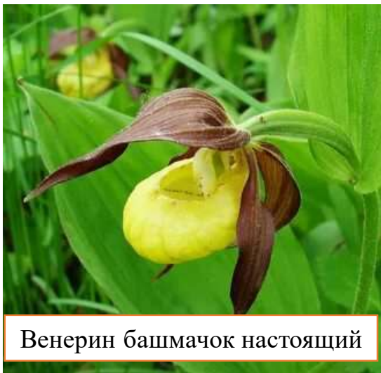
Венерин башмачок настоящий