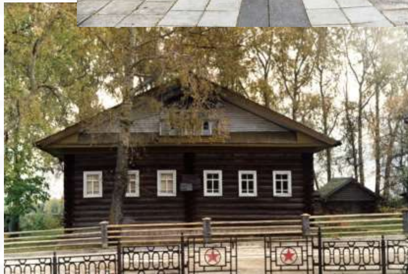
Конев Иван Степанович