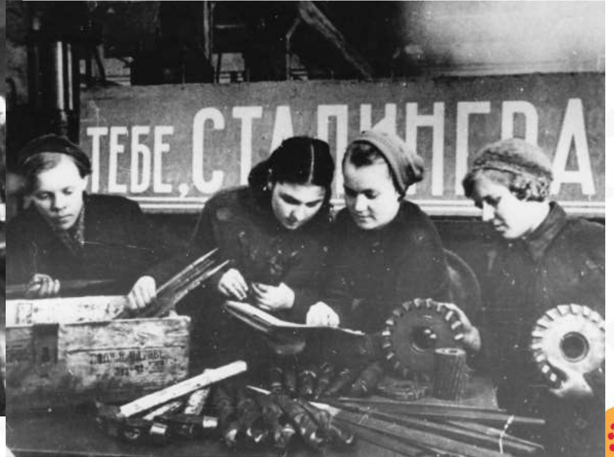
Комсомольцы готовят оборудование для отправки в г. Сталинград. 1943 г.