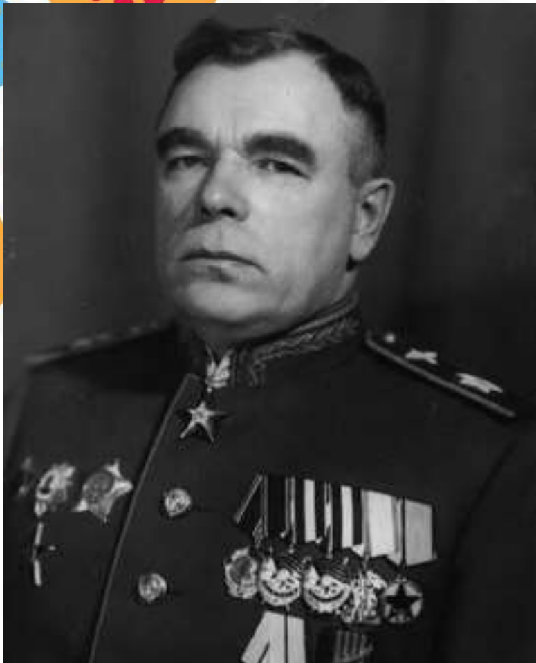
Фалалеев Федор Яковлевич (31 мая 1899 — 12 августа 1955) маршал авиации, уроженец дер. Полянское Малмыжского района