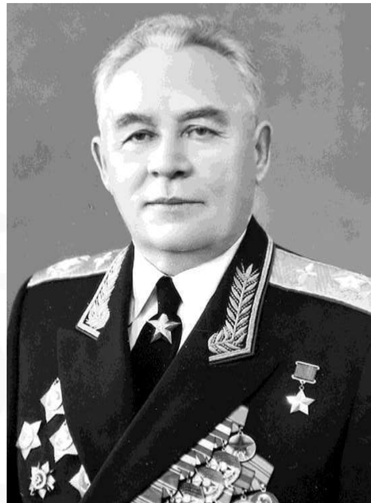
Вершинин Константин Андреевич (21 мая 1900 - 30 декабря 1973) Главный маршал авиации, Герой Советского Союза, уроженец дер. Боркино Яранского района