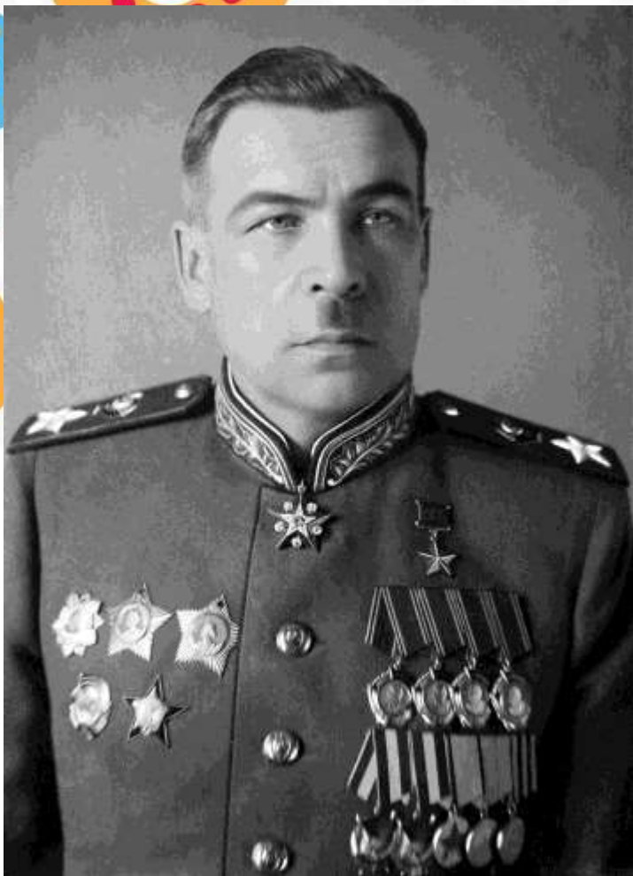
Говоров Леонид Александрович (22 февраля 1897 - 19 марта 1955), Маршал Советского Союза, Герой Советского Союза, уроженец с. Бутырки Яранского района