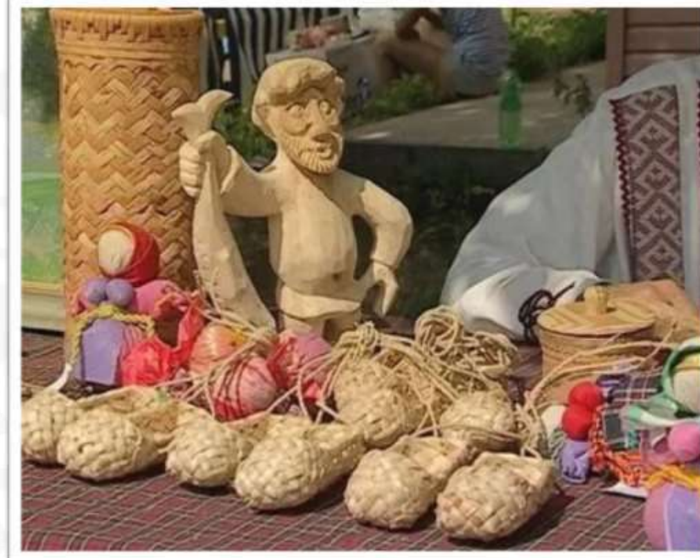
Праздник «Вятский лапоть»