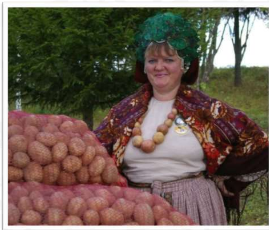
Праздник «Вятская картошка»