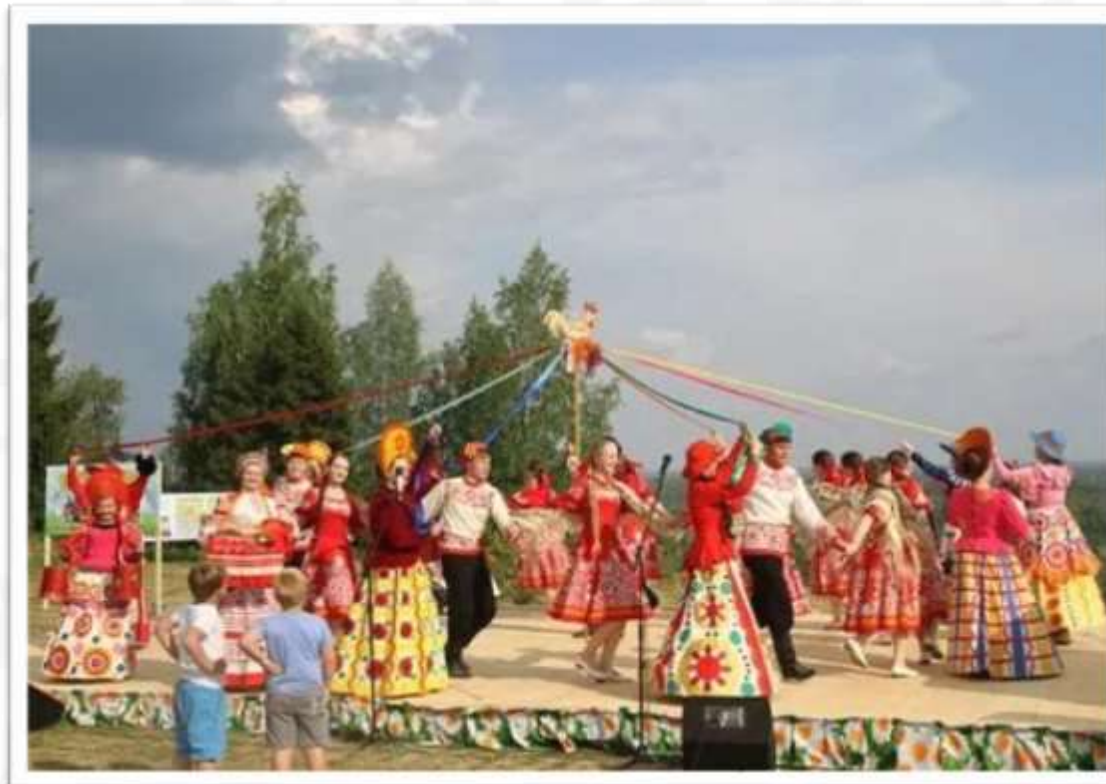
Праздник «Вятский лапотъ»