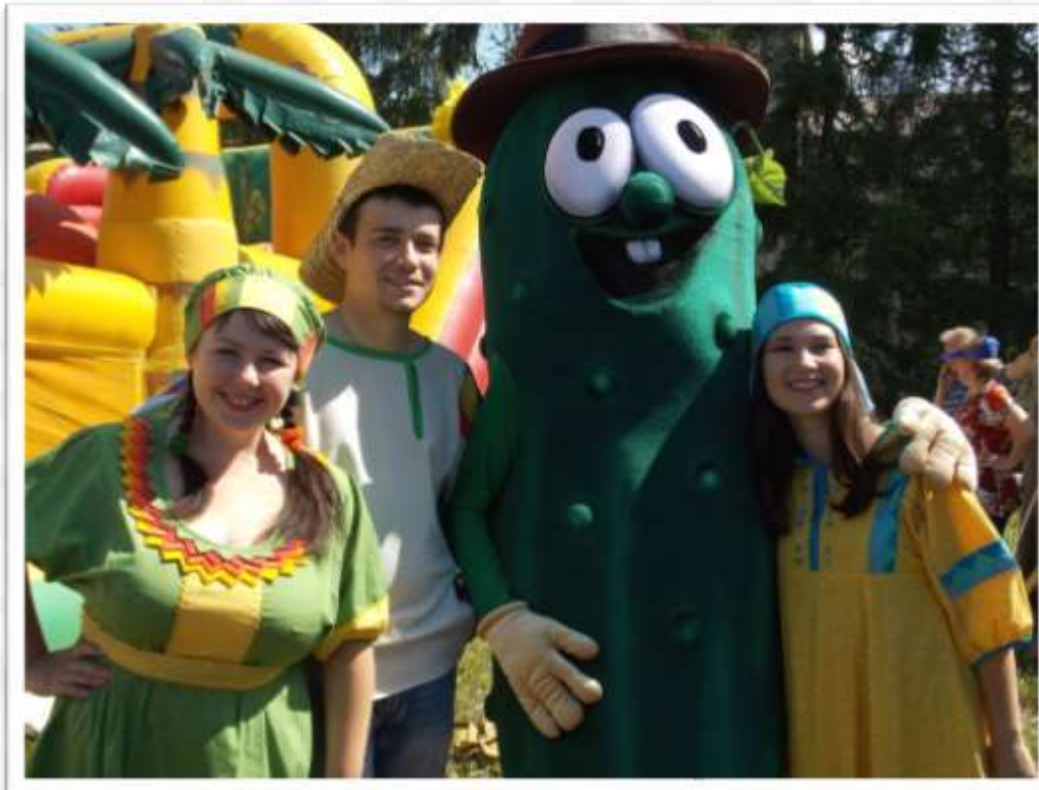
Праздник «Истобенский огурец»