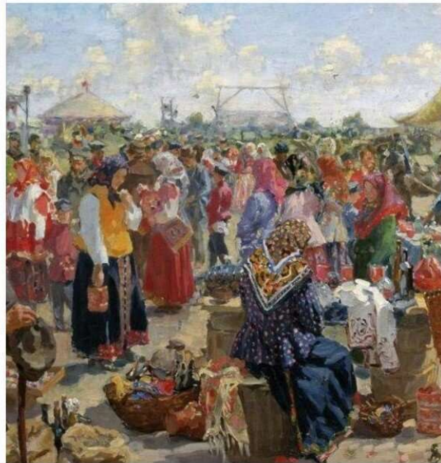
Праздник «Вятский лапотъ»