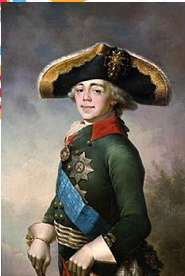
Император Павел I