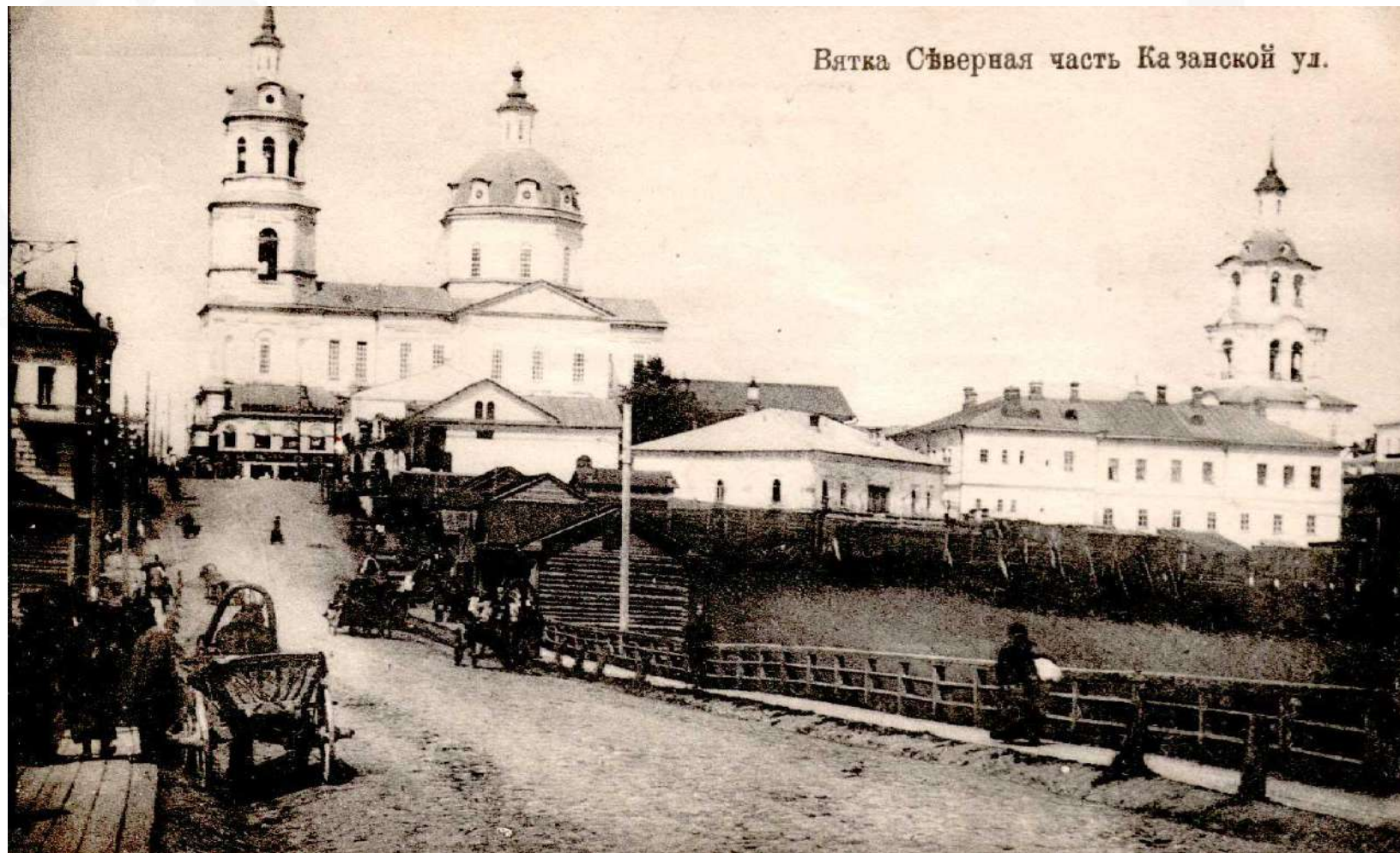
Вятка Сѣверная часть Казанской ул.