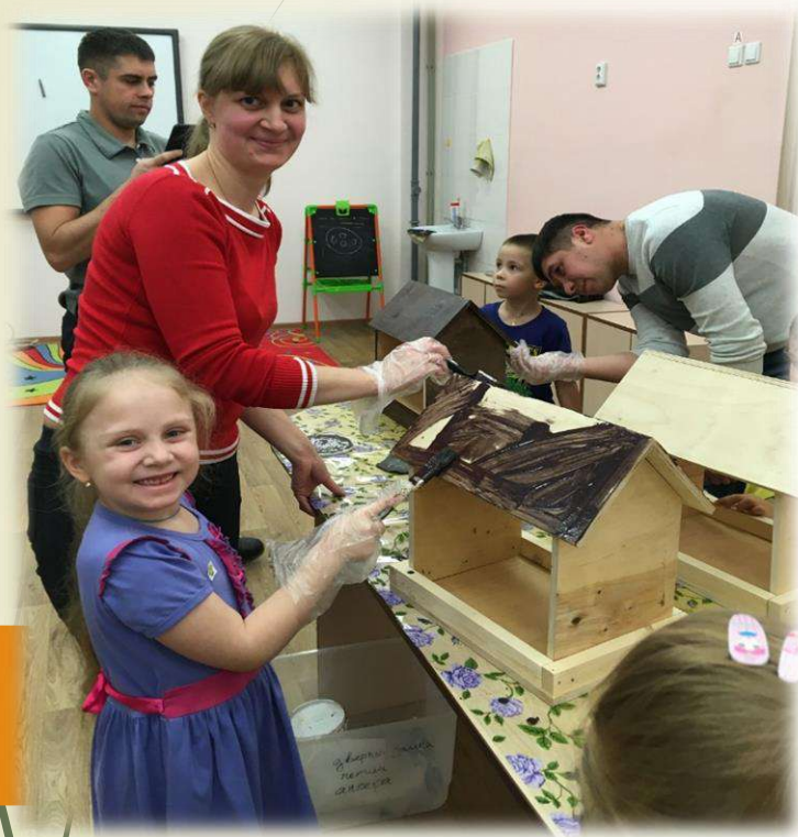
«Кормушка для птиц»