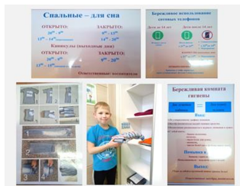
Рисунок 5. Стандартизация

визуально видят, как выполнять простые действия согласно правилам, инструкциям (рис. 5). Главное – выполнять быстро, эффективно и постоянно. И это должно войти в их привычку.