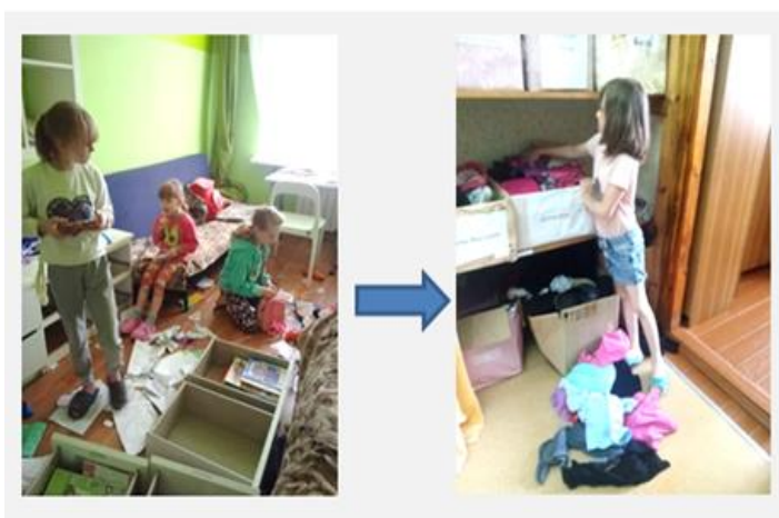
Рисунок 2. Сортировка

Комментарий: на рабочем месте должны находиться в необходимом количестве только те предметы, которые требуются для выполнения текущей