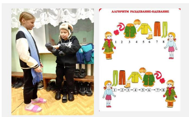
Рисунок 3. Собираемся на прогулку

Игра 3 «Собираемся на прогулку» (рис. 3). Дети рассматривают карточки с изображением времен года – соотносят картинку с предметом одежды, рассказывают о последовательности одевания. Игра помогает формировать навыки аккуратности и элементарного ухода за одеждой. Планируемый результат – минимизация потерь, времени и усилий, стандартизация порядка самостоятельных действий правильного одевания.