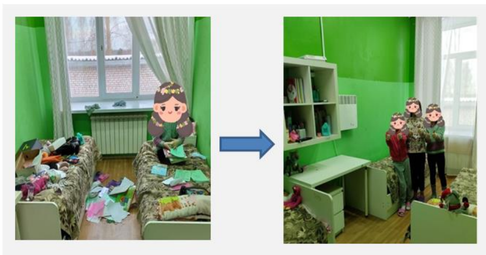
Рисунок 4. Содержание в чистоте

Комментарий: уборка – это не только поддержание порядка и чистоты, но проверка рабочих мест и групповых комнат.