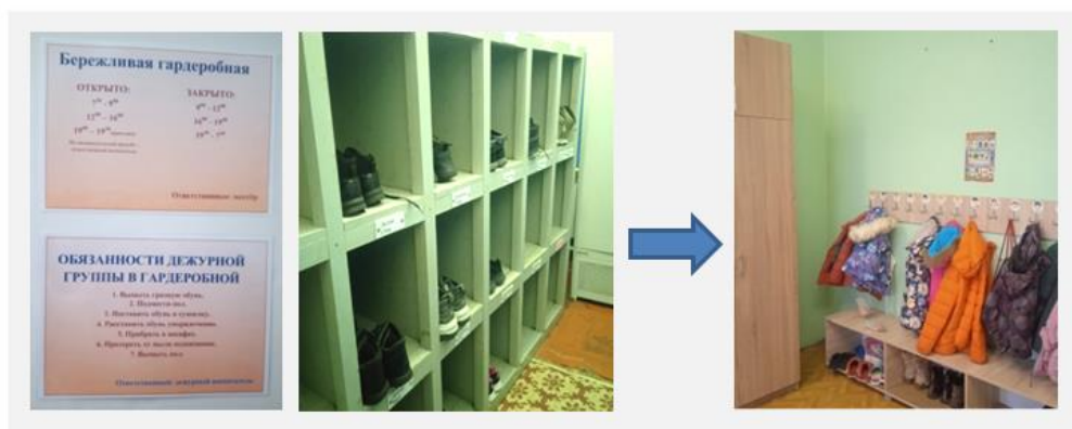
Рисунок 6. Бережливая гардеробная

Реализация первых четырех этапов бессмысленна, если не совершенствовать свою деятельность в рамках данной системы (рис. 6).