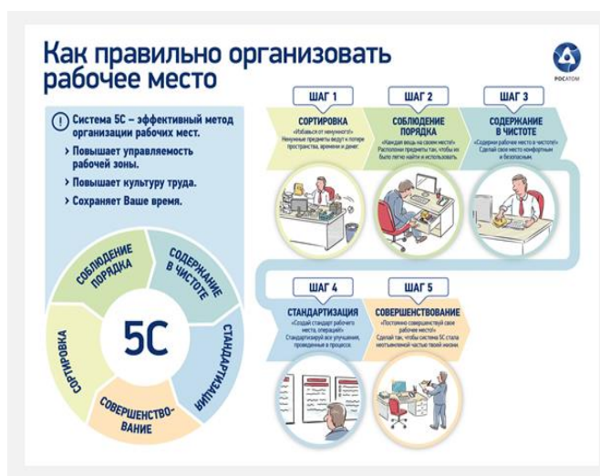
Рисунок 1. Принцип 5С

На сегодняшний день во все сферы деятельности внедряется подход «бережливое производство», не исключением стали Центры помощи детям, которые имеют множество специфических особенностей. Попадая в наш Центр, можно заметить много указателей, табличек, схем. Глядя на них, быстро ориентируешься, находишь нужный кабинет, группу, как следствие, экономишь время. С этого и начинаются «бережливые технологии».