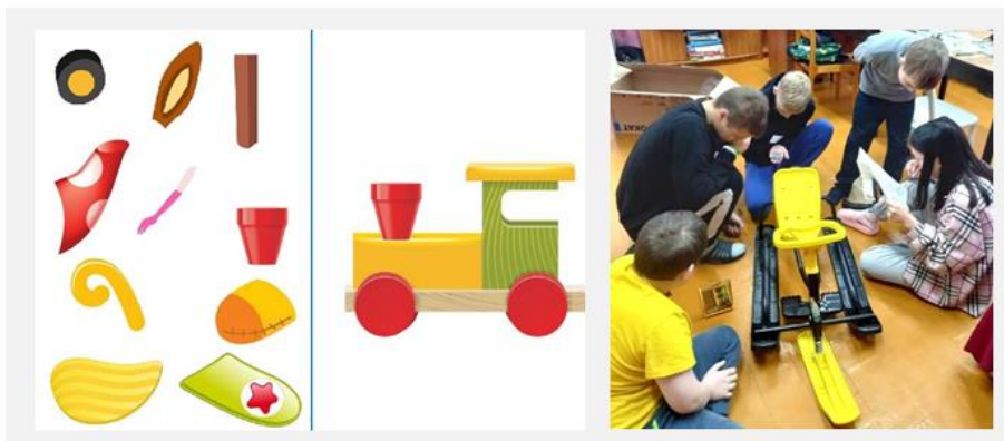
Рисунок 5. Исправление ситуации

Знания, полученные в форме игры, усваиваются легче. Педагог может варьировать правила игры, усложняя ее в памятках, схемах-алгоритмах, создавать проблемную ситуацию, исходя из индивидуальных особенностей играющих.