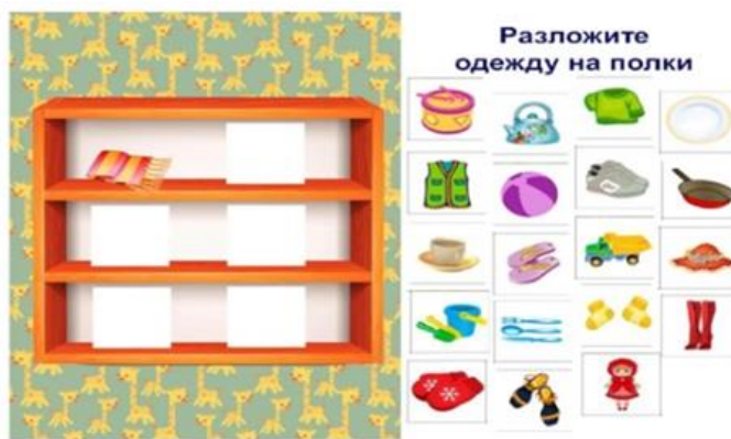
Рисунок 1. Наведи порядок на полке

Игра 1 «Наведи порядок на полке» учит устанавливать причинно-следственные связи (рис. 1). Детям раздаются карточки с изображением полок и разрезные картинки посуды и одежды, необходимо назвать группу похожих предметов по назначению и разложить