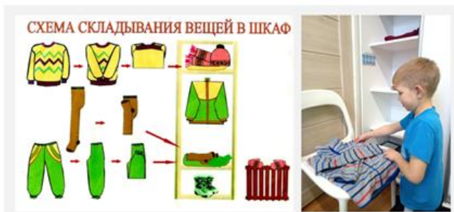
Рисунок 2. Складывание одежды по образцу

Игра 2 «Складывание одежды по образцу» (метод визуализации) учит правильно складывать одежду (рис. 2). Дети выбирают карточку с изображением одежды (кофта, брюки) и складывают по образцу на полки в шкаф. Планируемый результат: было – стало, формируется навык ухода за одеждой.