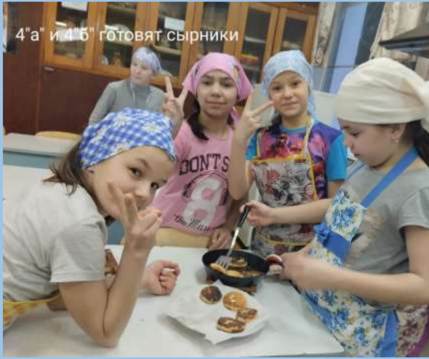
4"а" и 4"б" готовят сырники