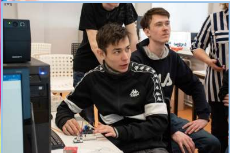
Участие в профессиональных пробах

1) организация помощи обучающимся с ОВЗ в профессиональной ориентации, помощи в осознанном выборе будущей профессии: