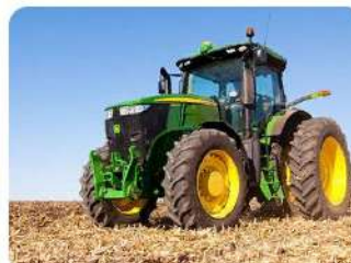
Тракторист-машинист сельскохозяйственного производства 35.01.13