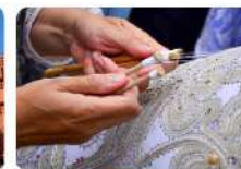
Кружельница | 13209