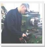
Альбом «История успеха выпускников ПОО»