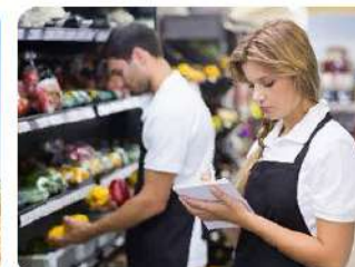
Продавец, контролер-кассир 38.01.02