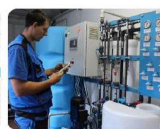
Мастер по ремонту и обслуживанию инженерных систем жилищно-коммунального хозяйства 08.01.26