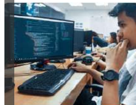
Информационные системы и

Требования для поступления: - аттестат основного общего образования (9 классов) или - аттестат среднего общего образования (11 классов)