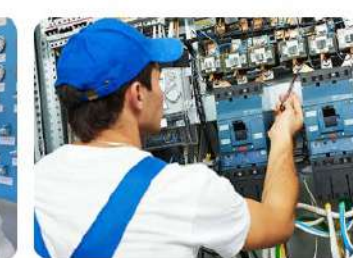
Электромонтёр по ремонту и обслуживанию электрооборудования (по отраслям) 13.01.10