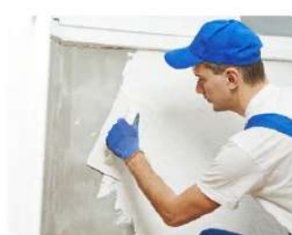
Мастер отделочных строительных и декоративных работ 08.01.25