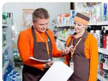
Товароведение и экспертиза качества потребительских товаров 38.02.05