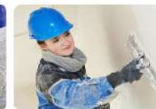
Маляр | 13450