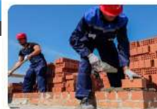
Кирпичник | 12880