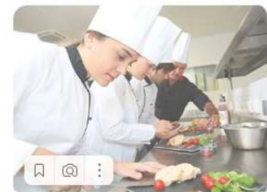
Технология продукции общественного питания 19.02.10