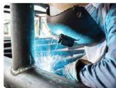
Сварщик | 15.01.05

Сварщик – сварочником наличие электрооса газоплазма