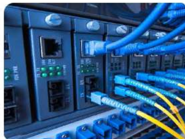
Сетевое и системное администрирование 09.02.06