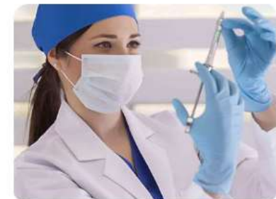
Сестринское дело 34.02.01