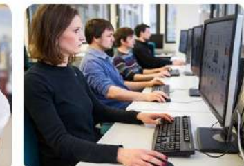
Оператор информационных систем и ресурсов 09.01.03