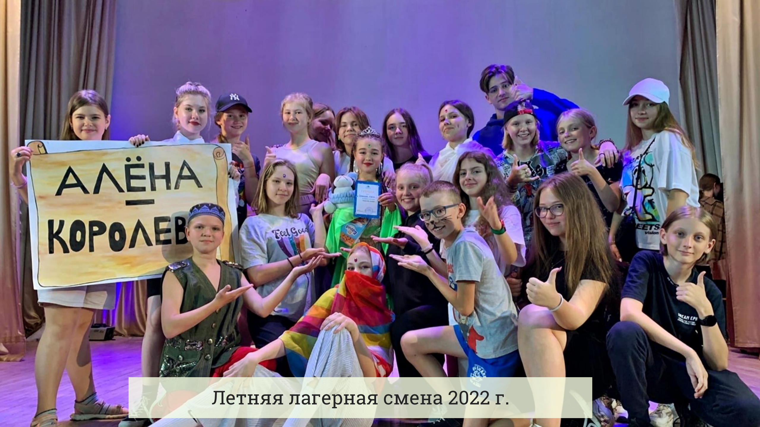
Летняя лагерная смена 2022 г.