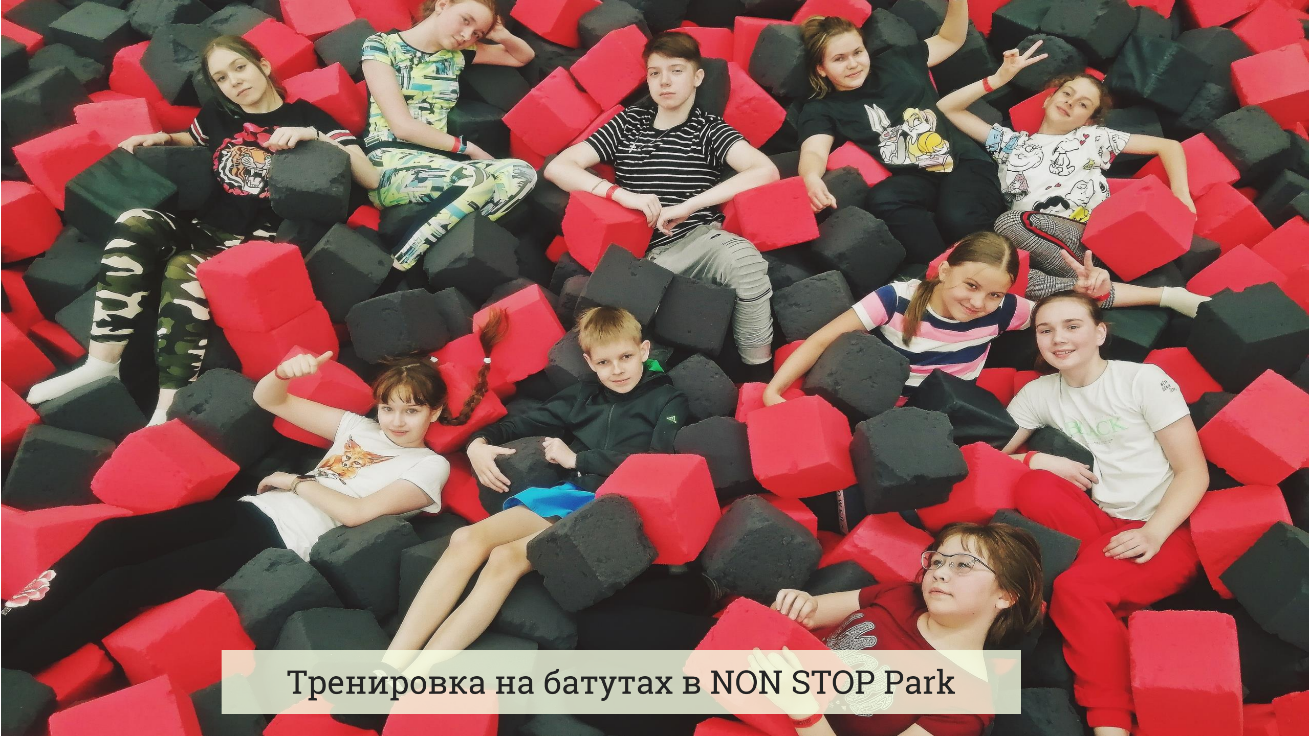
Тренировка на батутах в NON STOP Park