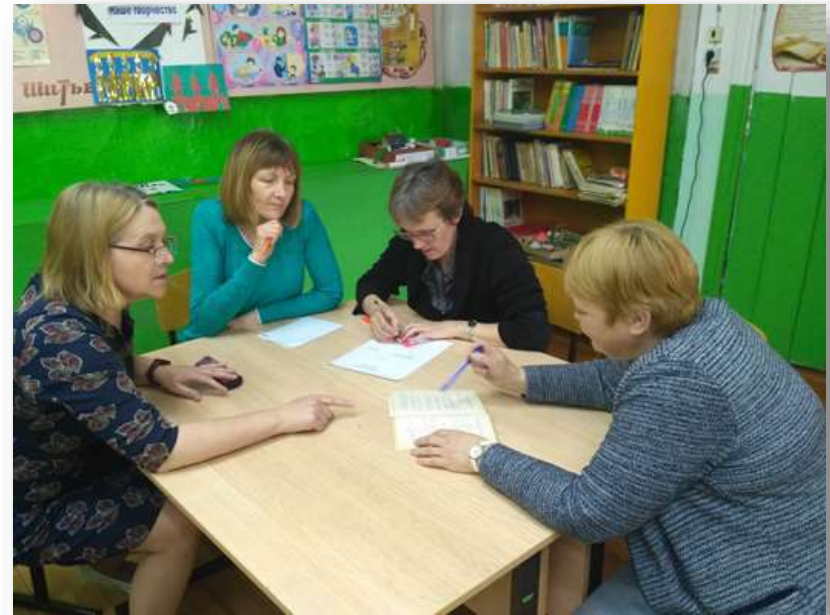
Участие педагогов школы в методическом марафоне по модулю «Формирующее оценивание» (с. Верхотулье)