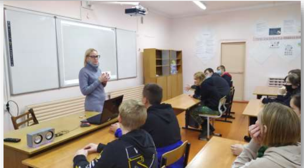
Классные часы по профилактике буллинга