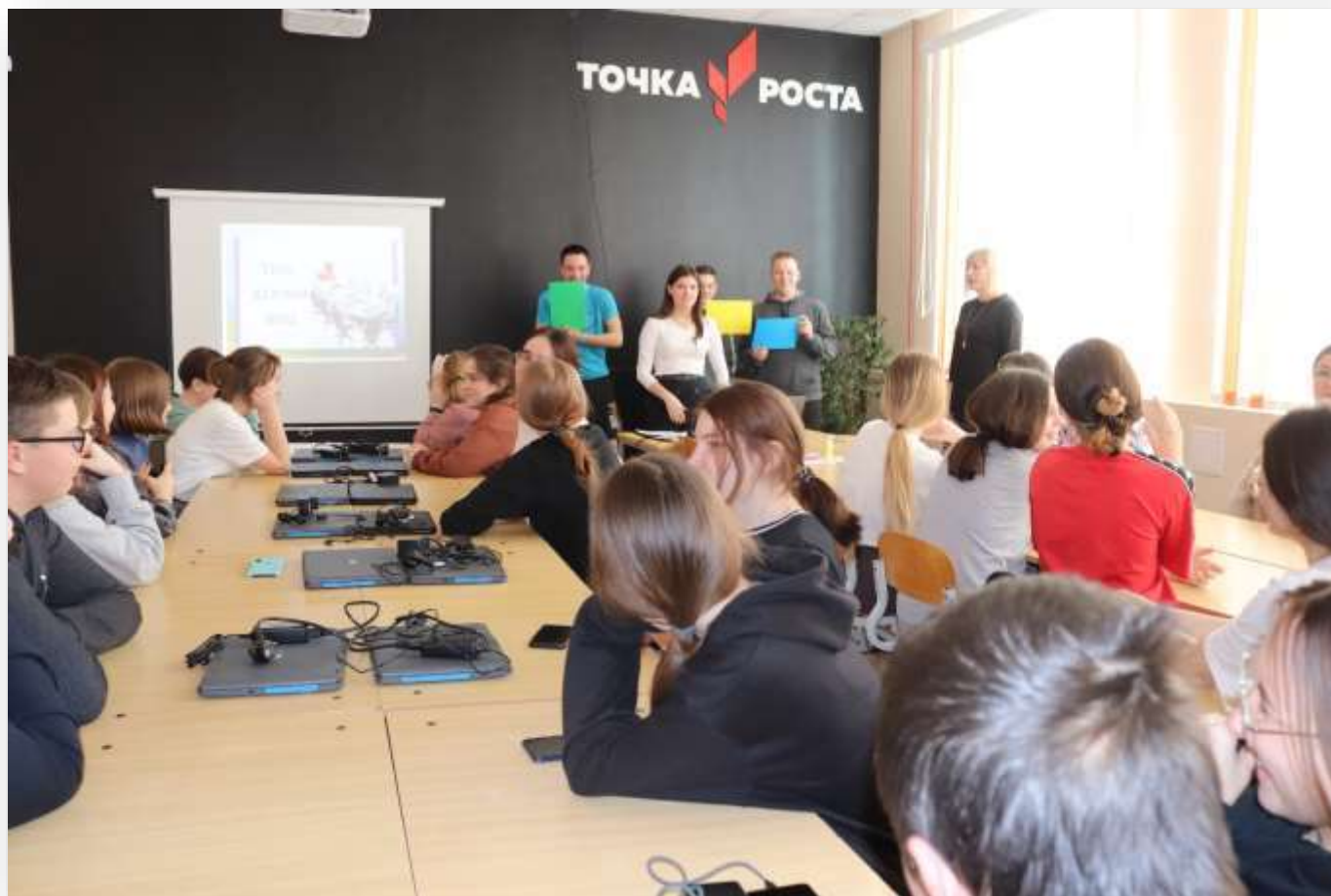
Занятие районного профильного педкласса на базе КОГОБУ СШ пгт Арбаж. Встреча с представителями Советского педучилища.