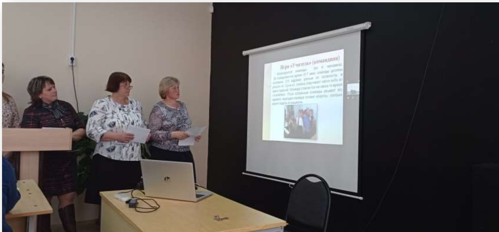
Районный педсовет «Воспитательный потенциал урока как средство формирования развивающейся личности» (апрель 2022 года) (6 выступающих КОГОбУ СШ с. Сорвижи)