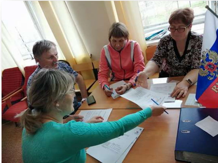
Участие педагогов школы в методическом марафоне по модулю «Исследование на уроке» (д. Мосуны)