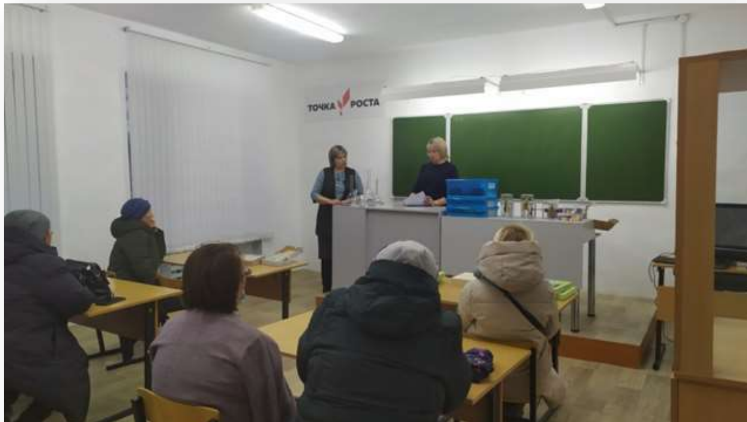
Родительское собрание «Взаимодействие семьи и школы по повышению качества знаний»