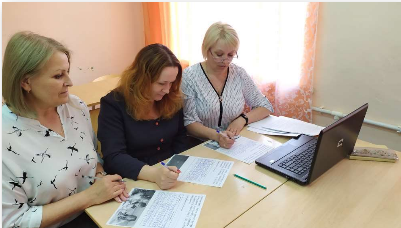
Участие педагогов школы в методическом марафоне по модулю «Школьный климат» (с. Сорвижи)