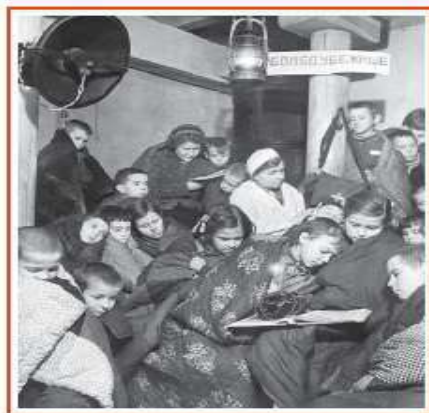
Дети в бомбоубежище во время блокады Ленинграда