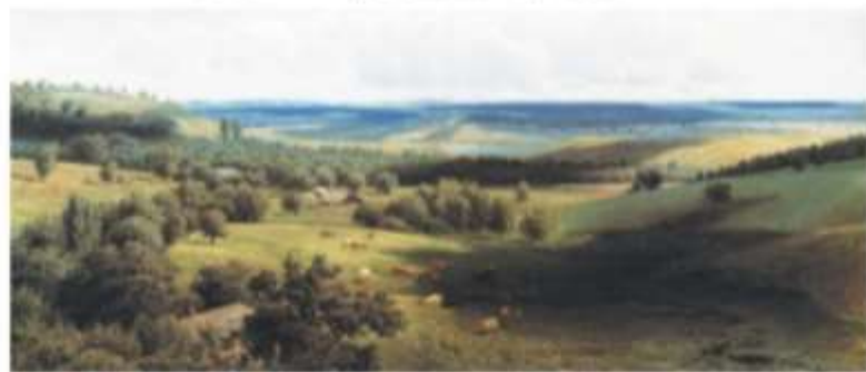
Н. А. Сергеев. Летний пейзаж

Вижу горы-исполины, Вижу реки и леса... Это — русские картины, Это — русская краса!