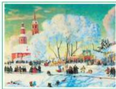
Е. М. Кустодиев. Масленица

Оттепели всё чаще, снег маслится. С солнечной стороны висят стеклянную бахромою сосульки, плавится-звизгают о льдышки... Прощай, зима! Это и по галкам видно, как они кружат «свадьбой», и цокающий их гомон куда-то ма-