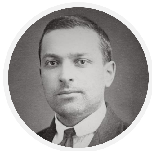
Л. С. Выготский