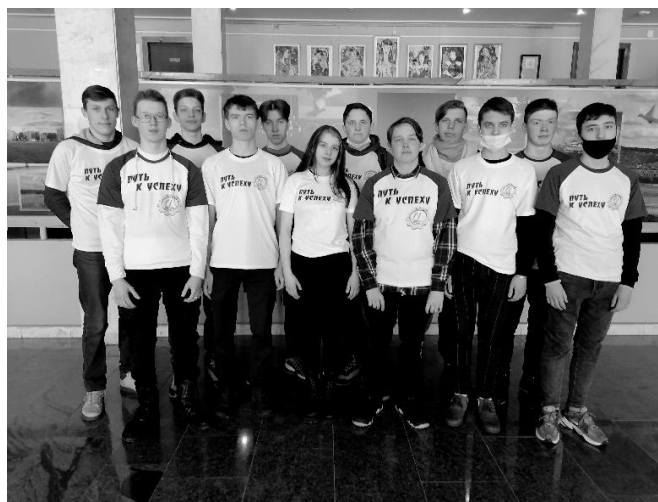
Организовываем и участвуем в акциях

Я, сама того не замечая, активно влилась в их среду. Я горжусь, что участвую в волонтерском движении нашего отряда «Путь к успеху».