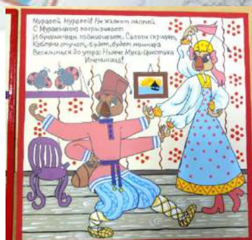
«Муха-Цокотуха» Корней Чуковский