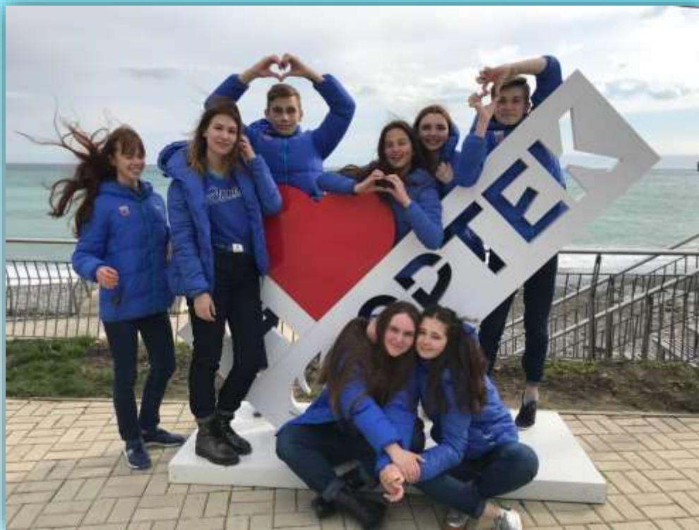
Театр-студия «Алые паруса» в МДЦ «Артек», 2018