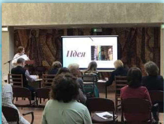
Конкурс профессионального мастерства «Педагог Дворца 2021»