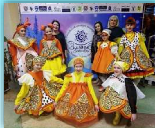
авторская коллекция «Мандаринки» ТМ «Вдохновение»