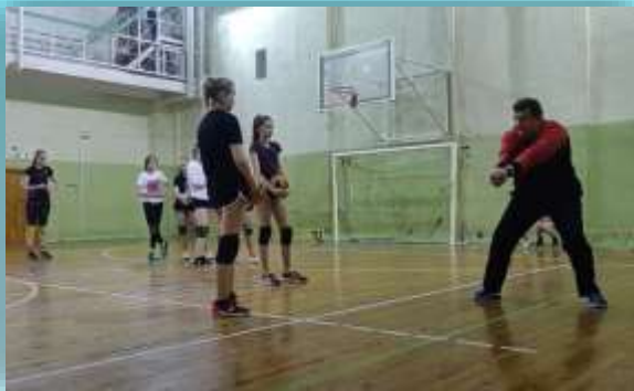
мастер-класс тренеров-преподавателей спортивной школы №2 г. Кирова, 27 марта 2021 г.