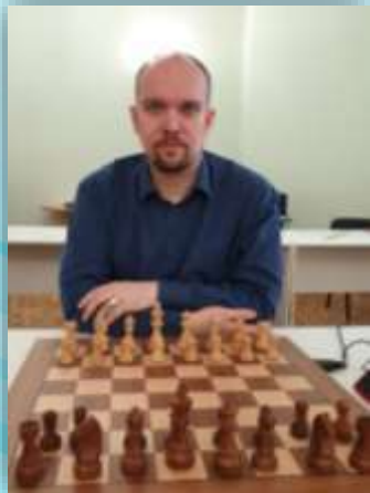
Онлайн сборки с международным мастером Мирославом Власенко, август 2021