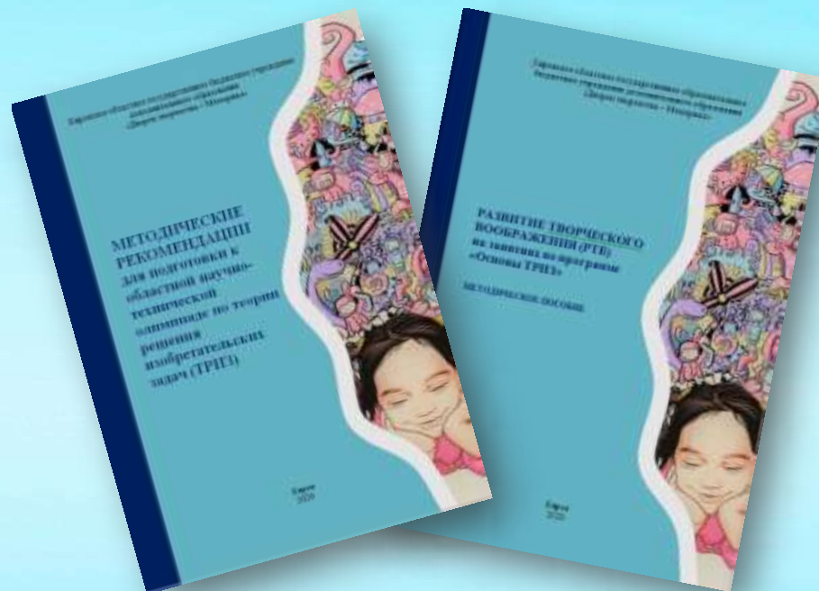
Методические материалы РИП «Развитие технологических компетентностей обучающихся в условиях дополнительного образования»