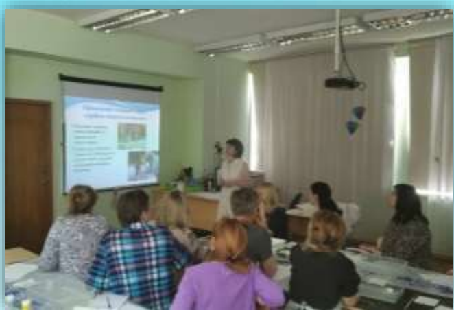
Обучающие семинары привлеченных специалистов