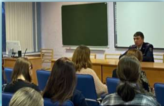
Встреча с профессионалом в специализированном клубе «Фемида», октябрь 2021