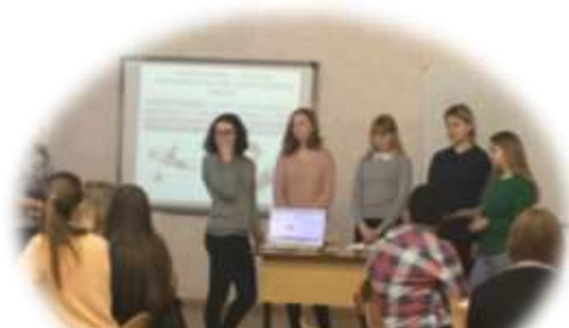
Работа в малых группах