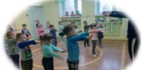
Подготовка к пед практики