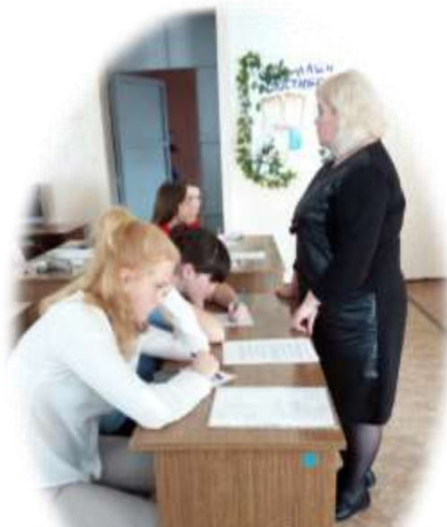
Работа с наглядными пособиями