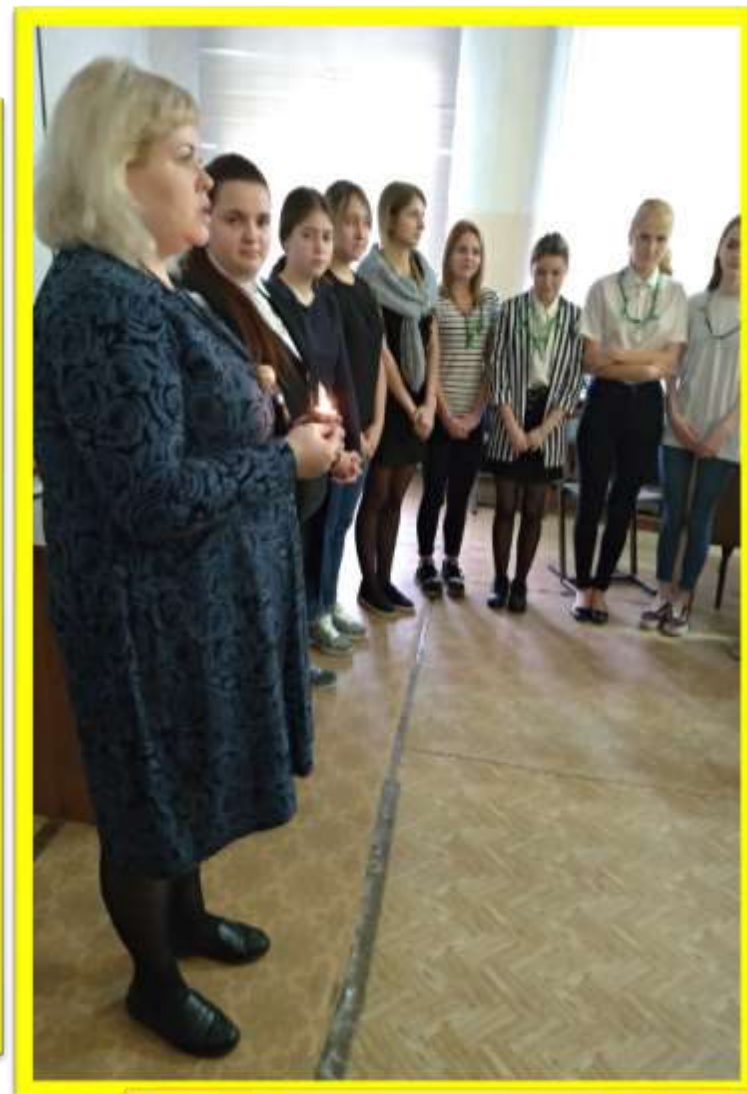
Рефлексия со свечой