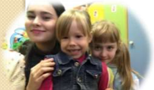
Подготовка к пед практики