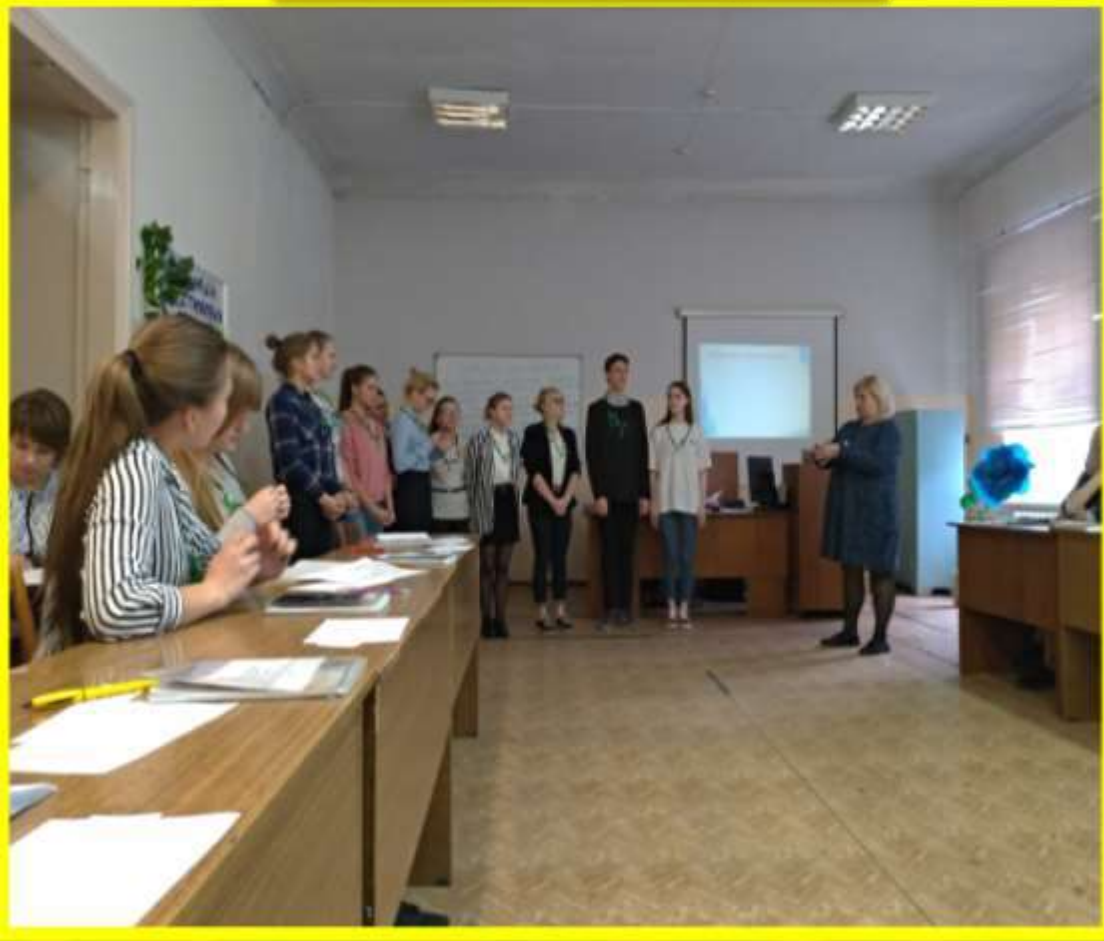
Игра на знакомство