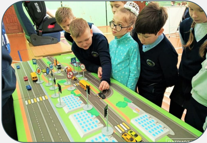
Региональный центр по профилактике детского дорожно-транспортного травматизма