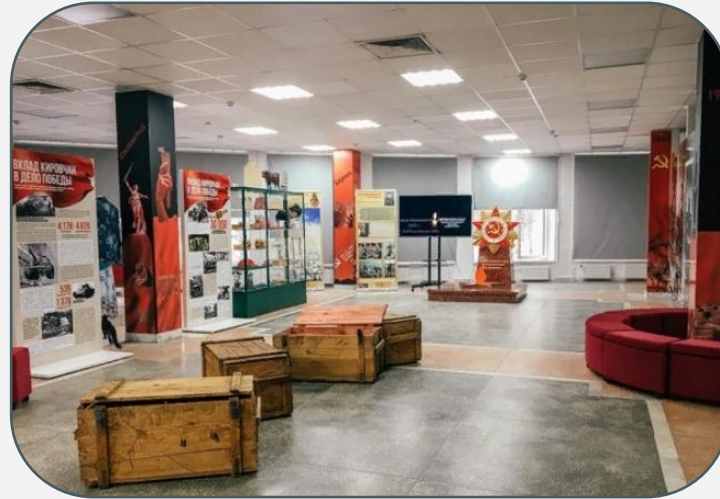
Центр поискового движения Кировской области «Поисковик» (стационарная экспозиция «История и деятельность поискового движения Кировской области»)