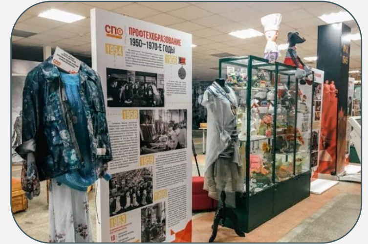
Стационарная экспозиция «История становления профессионального образования Кировской области»