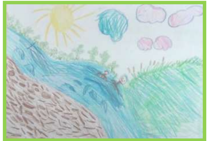
Рисование «4 времени года»