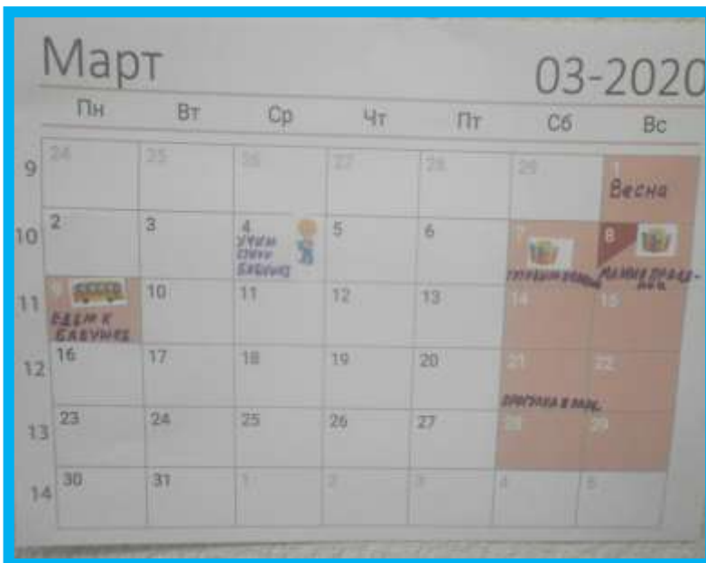
Детский календарь событий