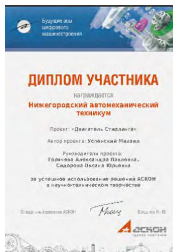
рис.1 Пример задания и сертификат конкурса «Будущие асы цифрового машиностроения»

В конце 3-го курса проводятся отборочные соревнования среди студентов, принимавших участие в подготовке к соревнованиям WorldSkills. Эти соревнования максимально приближены к условиям реальных конкурсов, задания берутся с прошлогодних соревнований. Создание таких реальных условий помогают студентам представить весь регламент соревнований: режим и темп выполнения работы, правильно рассчитать время и силы, проверить свои знания и навыки. По итогам отборочных соревнований определяются претенденты на участие в региональном конкурсе, который обычно проходит осенью. Студенты в это время учатся на 4-ом курсе, и для них это единственная возможность в качестве студента техникума принять участие в соревновании, поэтому отмечается сильная мотивация к победе.