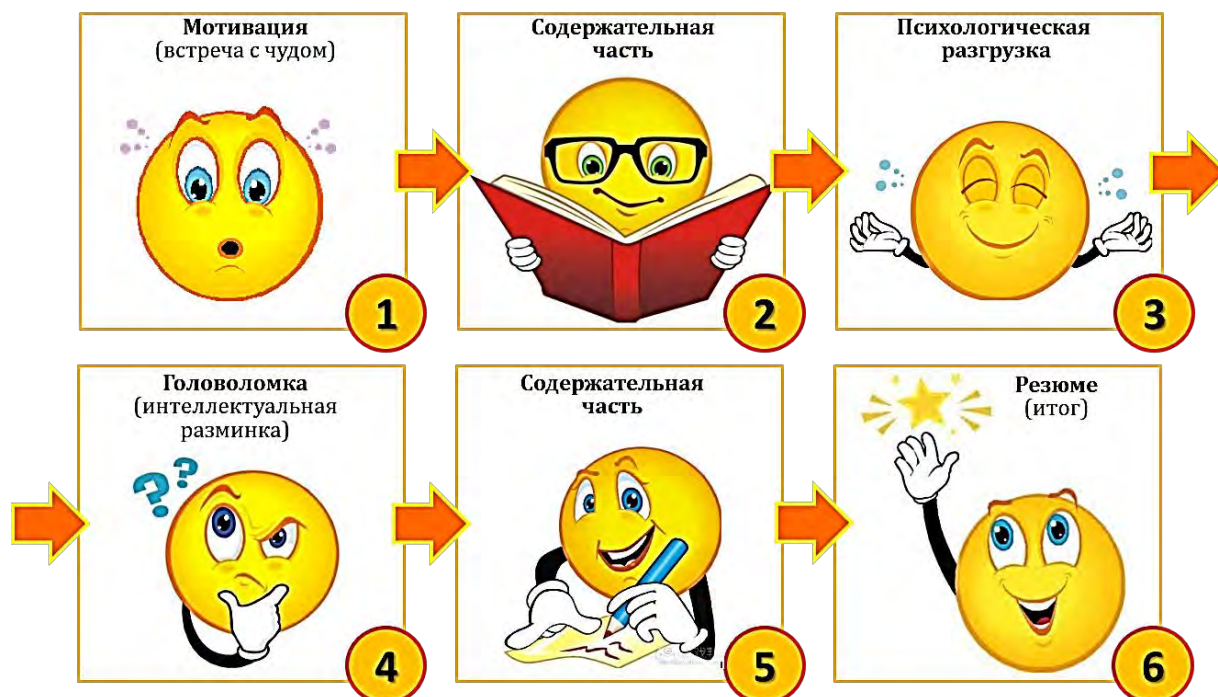
Схема креативного урока