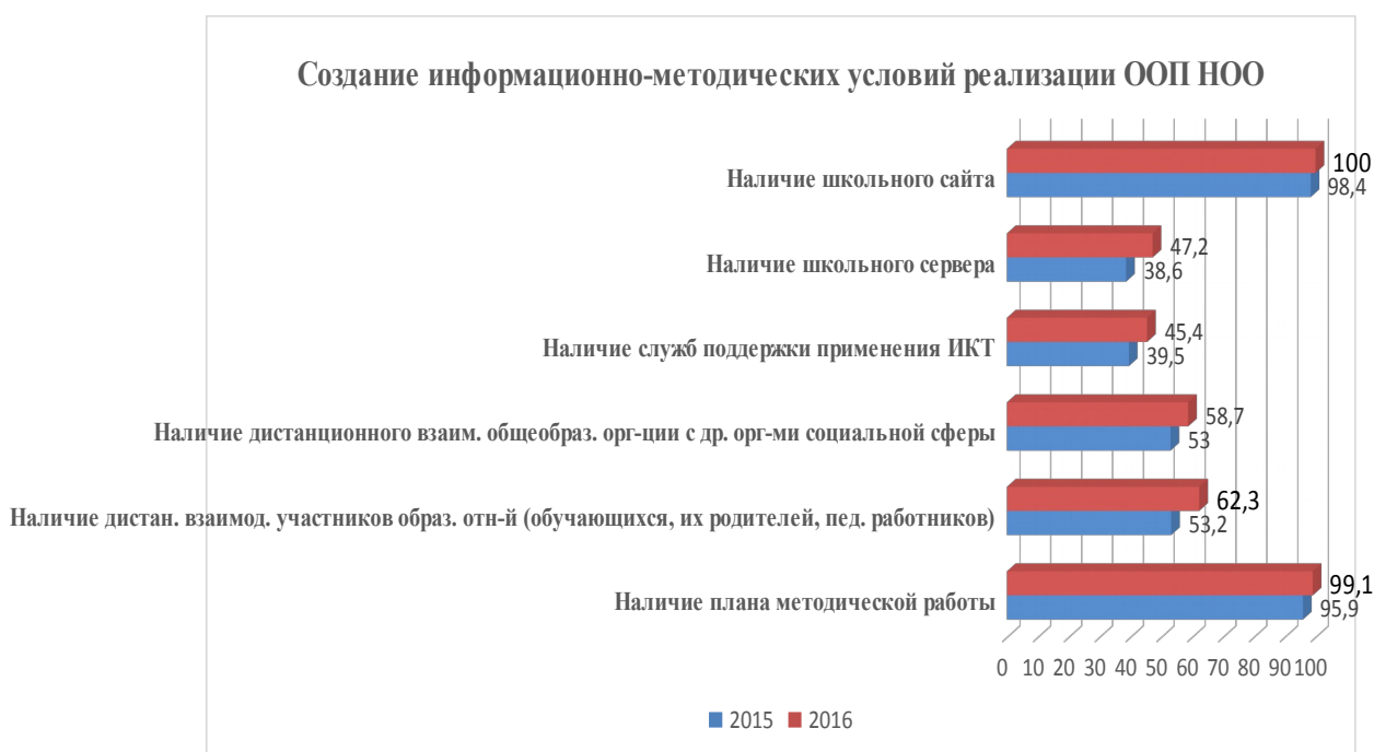
Диаграмма 5 – Создание информационно-методических условий

На диаграмме 5 представлены данные за 2015 г. и 2016 г.