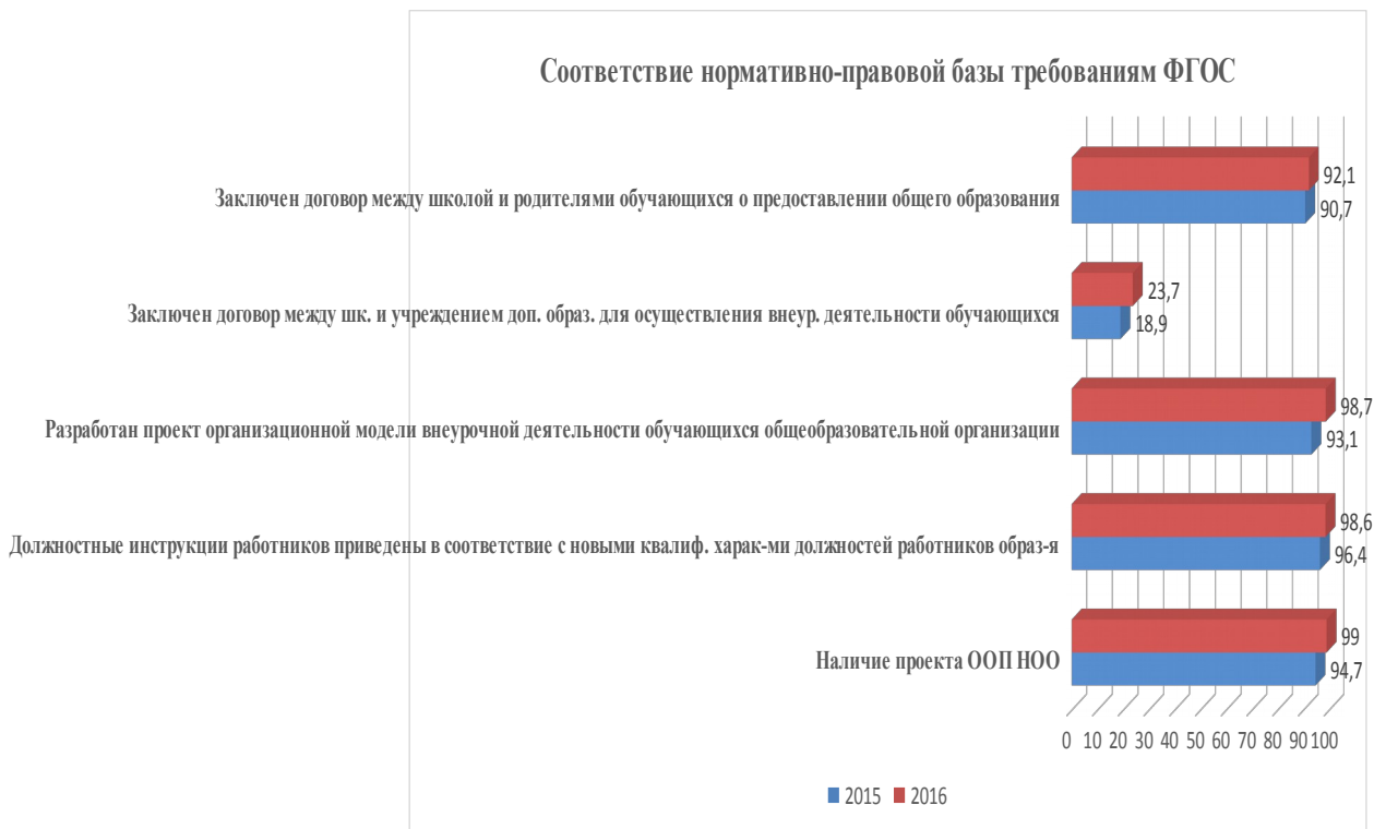
Диаграмма 1 – Соответствие нормативно-правовой базы требованиям ФГОС

В таблице 2 представлены данные о количестве организаций в разрезе образовательных округов, в которых нормативно-правовая база (за исключением договора между школой и учреждением дополнительного образования для осуществления внеурочной деятельности обучающихся) приведена в соответствие с требованиями ФГОС.