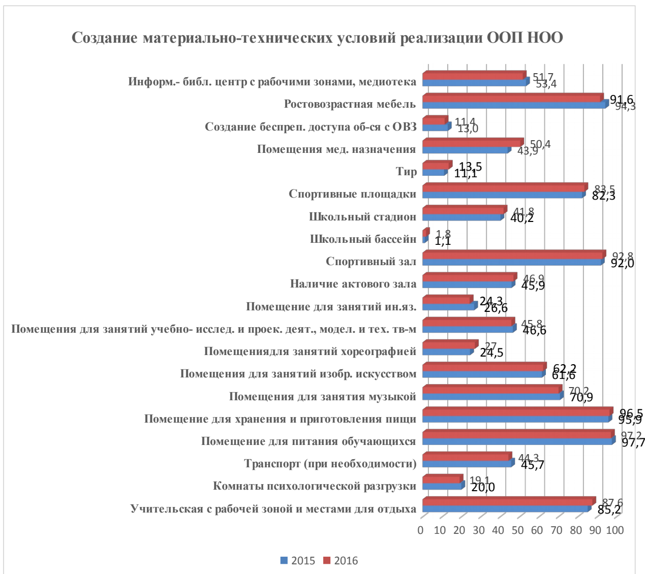
Диаграмма 3 – Создание материально-технических условий (помещения для организации образовательного процесса)

В таблице 5 представлено соответствие материально-технических условий реализации основной образовательной программы НОО санитарно-эпидемиологическим требованиям к образовательному процессу (помещения для организации образовательного процесса) в разрезе образовательных округов.