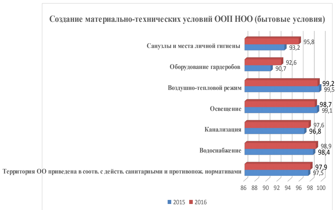
Диаграмма 2 – Создание материально-технических условий ООП НОО (бытовые условия)

В таблице 4 представлены данные показателей по критерию «Создание материально-технических условий реализации основной образовательной программы НОО (по пункту помещения для организации образовательного процесса).