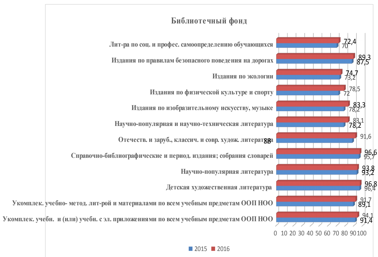
Диаграмма 6 – Наличие библиотечного фонда

В таблице 12 представлены данные по созданию информационно-методических условий реализации основной образовательной программы НОО (библиотечный фонд) в разрезе образовательных округов.